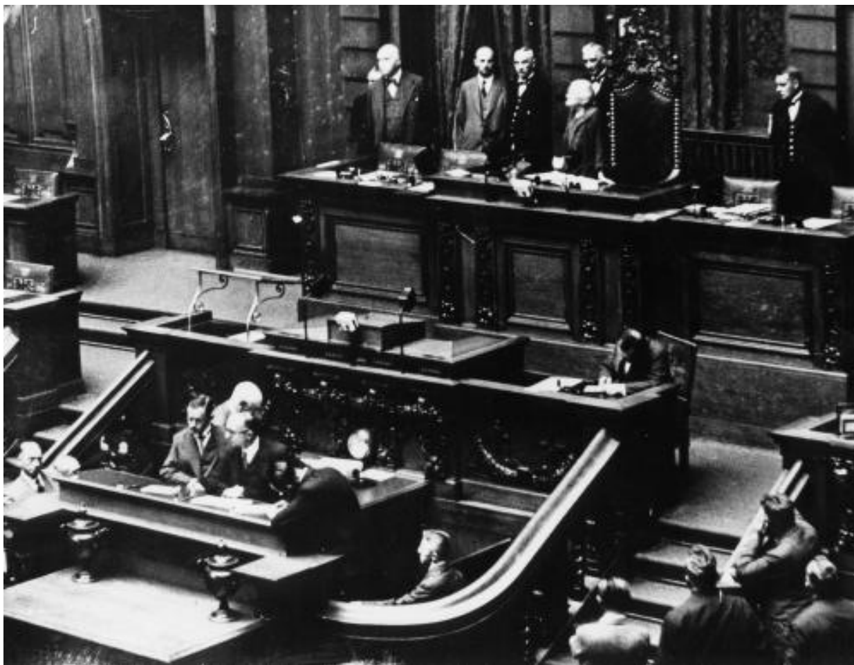
Clara Zetkin à la tribune du Reichstag le 30 août 1932

Hitler touche alors au but. Les élections du 31 juillet lui ont donné 38% des voix. A la première séance du nouveau parlement, le 30 août, la masse de ses députés en uniformes brun de S.A., saluent le bras tendu Goering qui va se faire élire président du Reichstag. Clara Zetkin, députée communiste, 75 ans, presque aveugle, monte lentement à la tribune, soutenue par deux personnes. D'une voix d'abord à peine audible, mais qui s'affermite de plus en plus, elle prononce un long appel à combattre l'hitlérisme: « Il s'agit d'abord et avant tout d'abattre le fascisme qui veut réduire à néant par le fer et par le sang les manifestations de classe des travailleurs. L'exigence de l'heure, c'est le front unique de tous les travailleurs pour faire reculer le fascisme. »