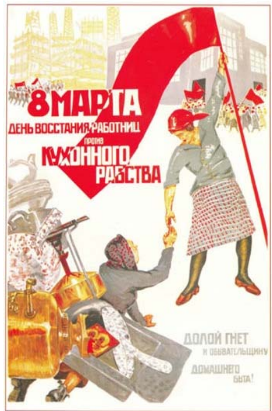
Tract pour le 8 mars 1914 (texte de Clara Zetkin)