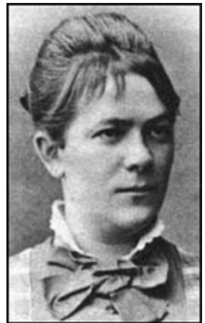
Clara Zetkin à 18 ans