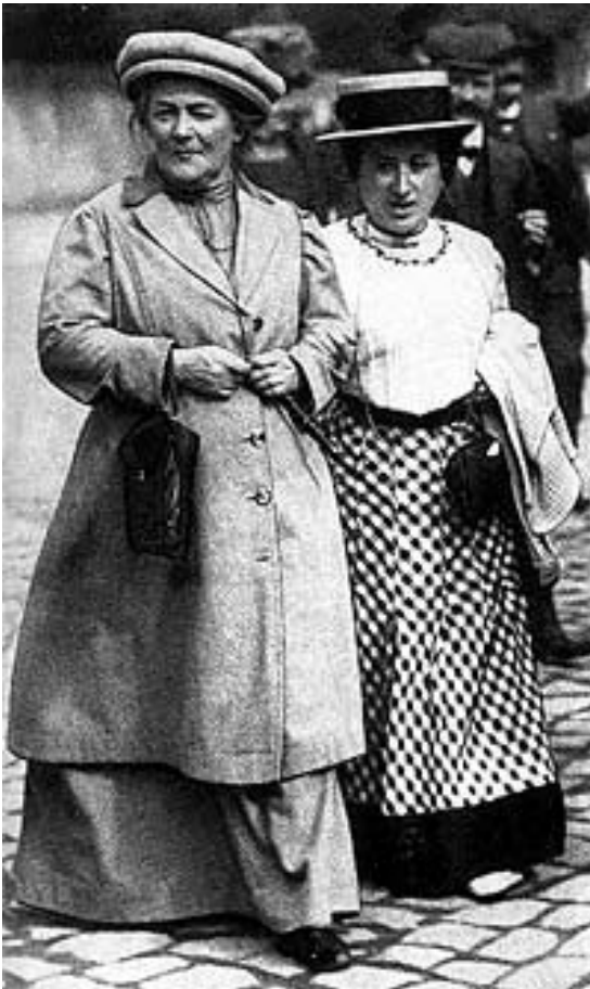
Clara Zetkin et Rosa Luxemburg.

avait continué, malgré la censure, à faire passer un souffle révolutionnaire et internationaliste. Les événements se précipitent, la révolution d'Octobre en Russie, en Allemagne, les grèves puis la révolution de novembre 1918, la répression sanglante du mouvement spartakiste par la droite sociale-démocrate où s'illustre Noske, l'assassinat en janvier 1919 à Berlin de Karl Liebknecht et de Rosa Luxemburg.