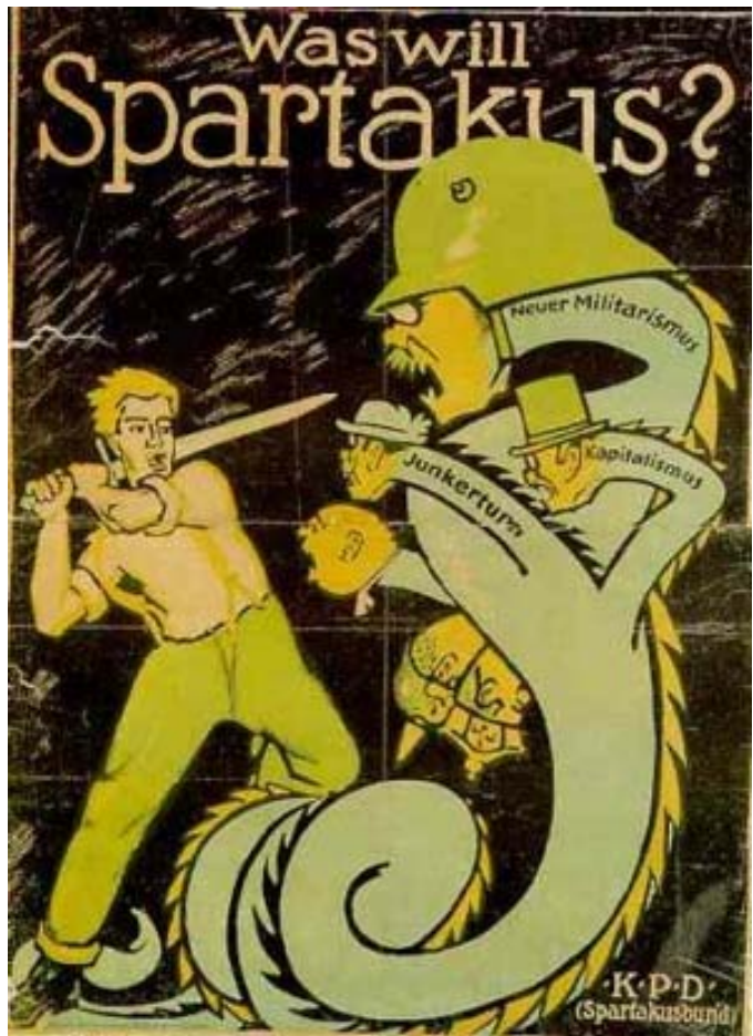
Affiche du Spartakusbund

En 1920, Clara Zetkin rejoint Ernst Thälmann, Ernst Toller et Walther Ulbricht pour former le Parti communiste d'Allemagne, dont elle devient dirigeante (membre du bureau central jusqu'en 1924 puis membre du comité central de 1927 à 1929). La révolution allemande de novembre 1918 permet au mouvement féministe d'obtenir le droit pour les femmes de voter et d'être élues: Clara Zetkin est élue députée KPD au Reichstag en 1920 et elle sera à chaque fois réélue pendant toute la durée de la République de Weimar.