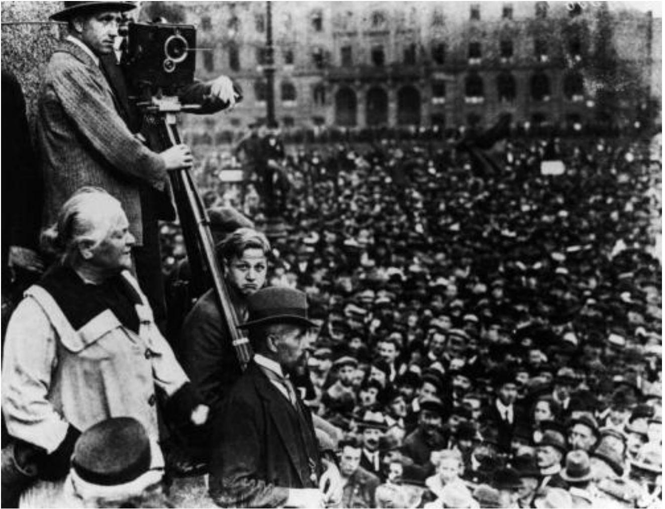
Clara Zetkin prenant la parole à une manifestation de masse du KPD, le 31 août 1921, au Lustgarten de Berlin