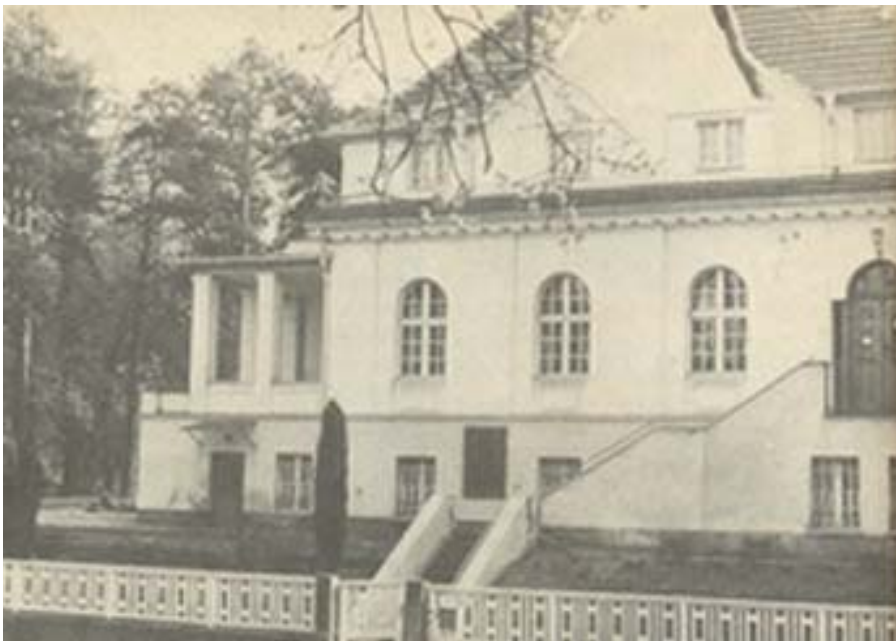
La maison familiale des Eissner

Clara Zetkin est née Clara Eissner, le 5 juillet 1857 à Wiederau, près de Chemnitz, en Saxe. Fille d'un instituteur de village, Clara Eissner se destine elle-même à l'enseignement et étudie à l'école normale féminine de Leipzig. Dès le milieu des années 1870, elle fréquente les mouvements féministes, participant aux discussions des Allgemeinen Deutschen Frauenvereins (Association générale des femmes allemandes) et elle commence à adhérer à la mouvance socialiste. En 1878, elle avait brillamment réussi son examen mais bien qu'elle aimât beaucoup sa profession, elle allait choisir une autre voie en adhérant aux idées socialistes qui se développaient dans l'essor industriel de l'Allemagne de Bismarck.