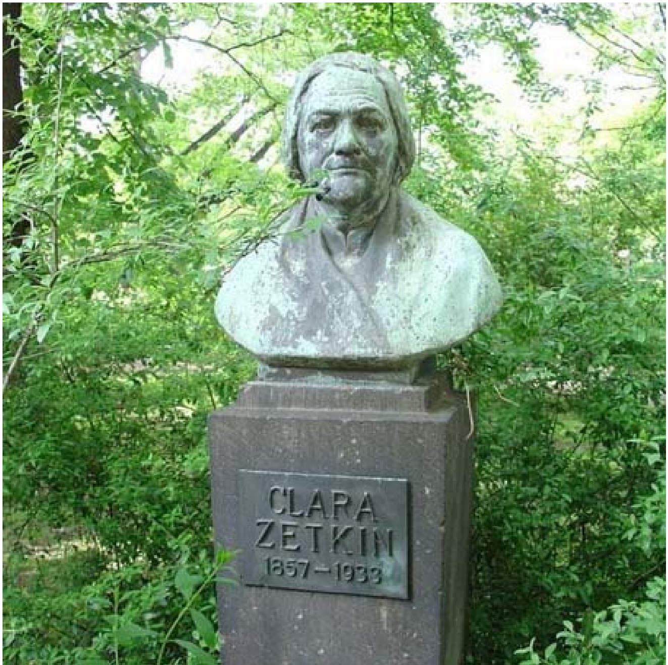
Monument à Clara Zetkin (Dresde).

Contrainte de fuir l'Allemagne après l'arrivée des nazis au pouvoir et l'interdiction du KPD, elle arrive à Moscou à bout de force et meurt quelques semaines plus tard le 20 juin 1933, à 75 ans, dans une maison de repos d'Arkhangelskoïe, près de Moscou. La tombe de Clara Zetkin se trouve le long des murs du Kremlin, sur la Place Rouge.