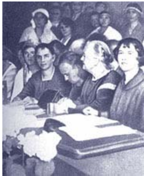
Clara Zetkin à Moscou. A gauche: Avec Alexandra Kollontai au IIIe Congrès du Komintern (1921)