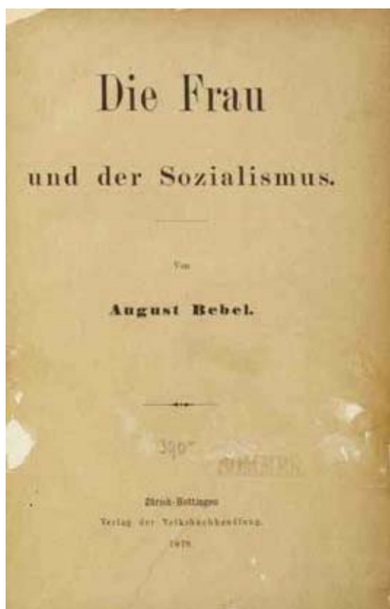
La femme et le socialisme

On mesure mal aujourd'hui la portée révolutionnaire de ces lignes qui eurent un impact immense. Clara Zetkin rendra de nombreuses fois hommage à Bebel et à son travail de pionnier. Elle le connaîtra d'ailleurs personnellement; c'est Bebel qui se chargera de la faire admettre dans un sanatorium en Forêt-Noire, lorsqu'elle sera atteinte de tuberculose peu après le Congrès de Paris en 1889.