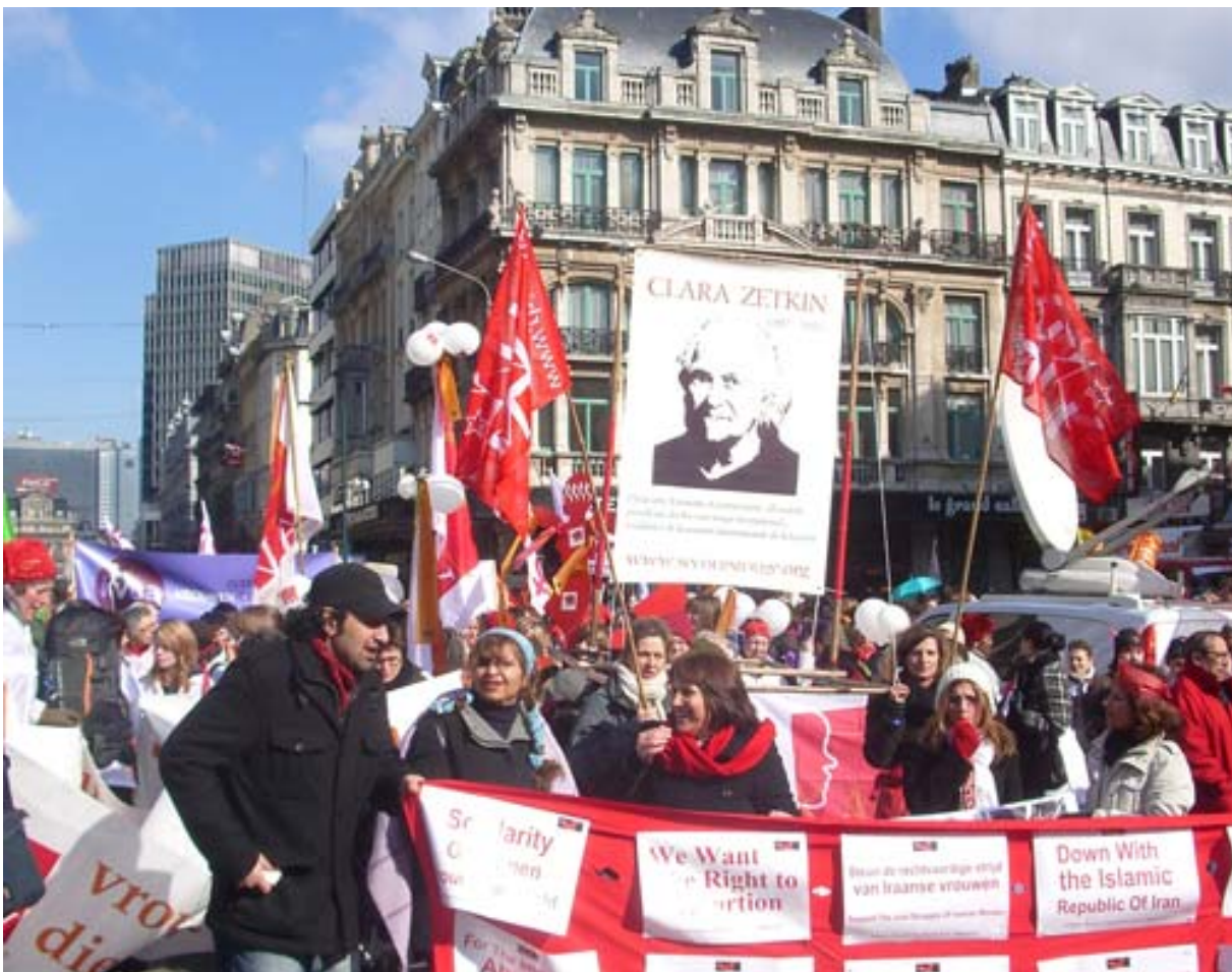
Le portrait de Clara Zetkin porté par la délégation de notre Secours Rouge à la manifestation de la Journée internationale de la femme.

Seule une société socialiste pourra résoudre le conflit produit de nos jours par l'activité professionnelle des femmes. Une fois la famille en tant qu'unité économique disparue, et remplacée par la famille en tant qu'unité morale, la femme deviendra une compagne ayant les mêmes droits, aussi créative, avec le même but vers l'avant que son mari; son individualité s'épanouira pendant qu'au même moment, elle remplira sa tâche d'épouse et de mère au plus haut point possible.