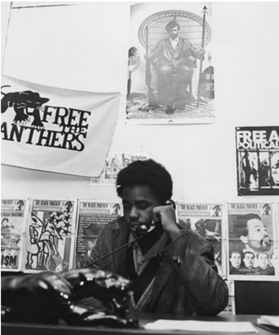
Mumia adolescent, militant du BPP à Philadelphie (1970)