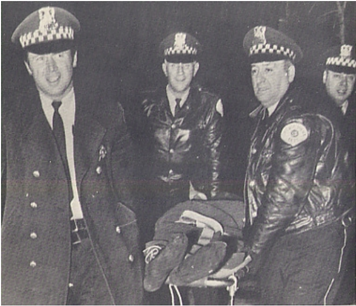
Les policiers, hilares, emportent le corps de Fred Hampton

présents ont également été la cible des tirs policiers, et notamment la compagne d'Hampton, alors enceinte.