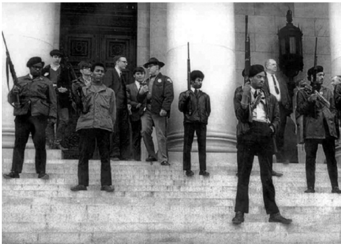
Démonstration de force du BPP à Seattle