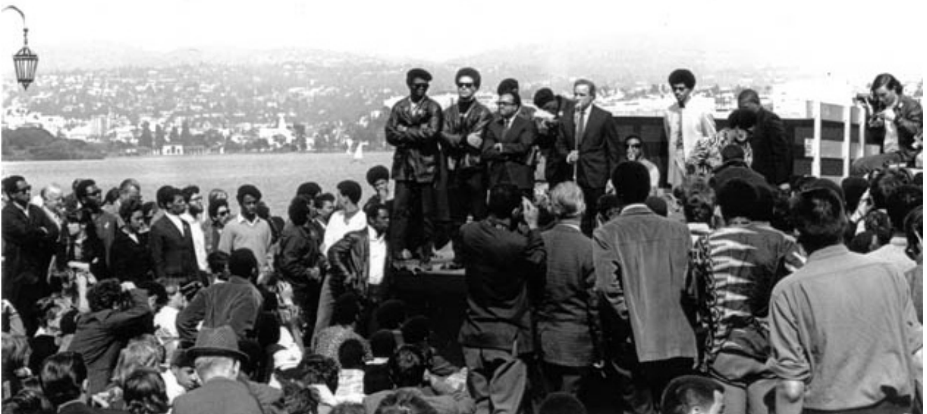
Manifestation d'hommage à Bobby Hutton

Le 7 avril 1968, huit membres du parti, dont Bobby Hutton, voyageaient dans deux voitures lorsqu'ils tombent dans une embuscade dans la police à Oakland. Bobby prend la fuite avec un camarade, et ils trouvent refuge dans un sous-sol. Très vite, ils sont cernés par plus de cinquante policiers qui prennent d'assaut le bâtiment, qui prend feu. Bobby en sort les mains en l'air, ayant enlevé son tee-shirt pour montrer qu'il était sans arme. Dès sa sortie, il est la cible de douze tirs qui le tuent sur le coup.