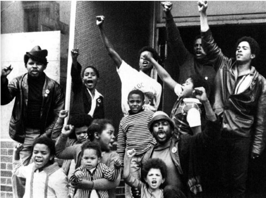
Ecoliers aidés par le programme social du BPP

Les objectifs du parti sont clairs: nourrir - soigner - éduquer.