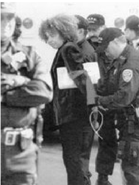
Angela Davies arrêtée en 2000 à San Francisco lors d'une manifestation pour Mumia

Angela Davis: née le 26 janvier 1944 dans l'état d'Alabama où ses parents sont enseignants. Elle étudie aux Etats-Unis, en France et en Allemagne. Elle reçoit sa maîtrise en 1968 et devient membre du Parti Communiste des Etats-Unis et du BPP. Elle commence à enseigner, mais est renvoyée à cause de ses convictions. En 1970, recherchée et arrêtée sous l'accusation de conspiration pour libérer des prisonniers du BPP. Elle passe 16 mois en prison avant d'être acquittée. Aujourd'hui, Angela Davis enseigne à l'université et continue son combat politique et social.