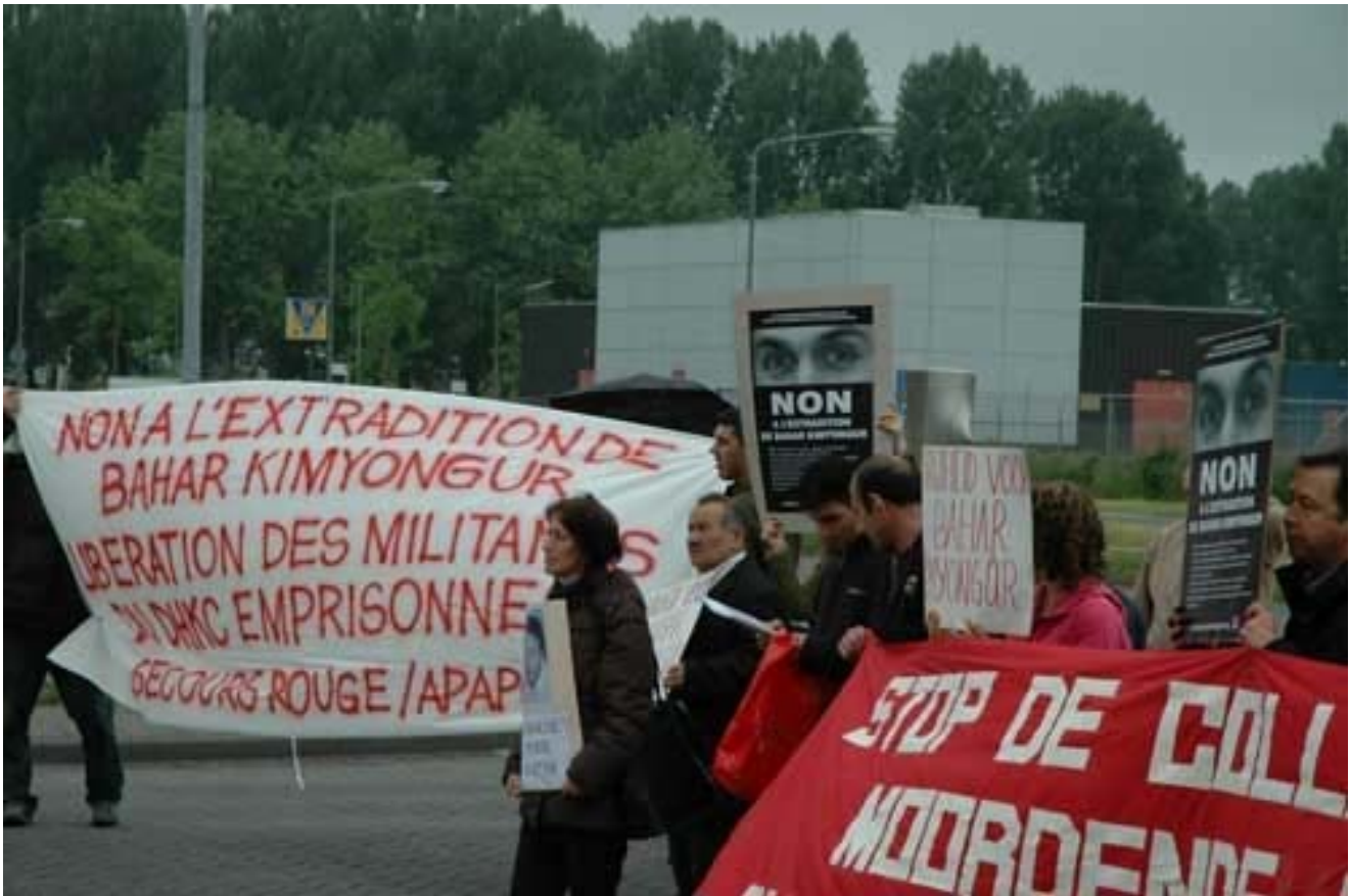
Manifestation devant la prison de Dordrecht (Pays-Bas), 27 mai 06