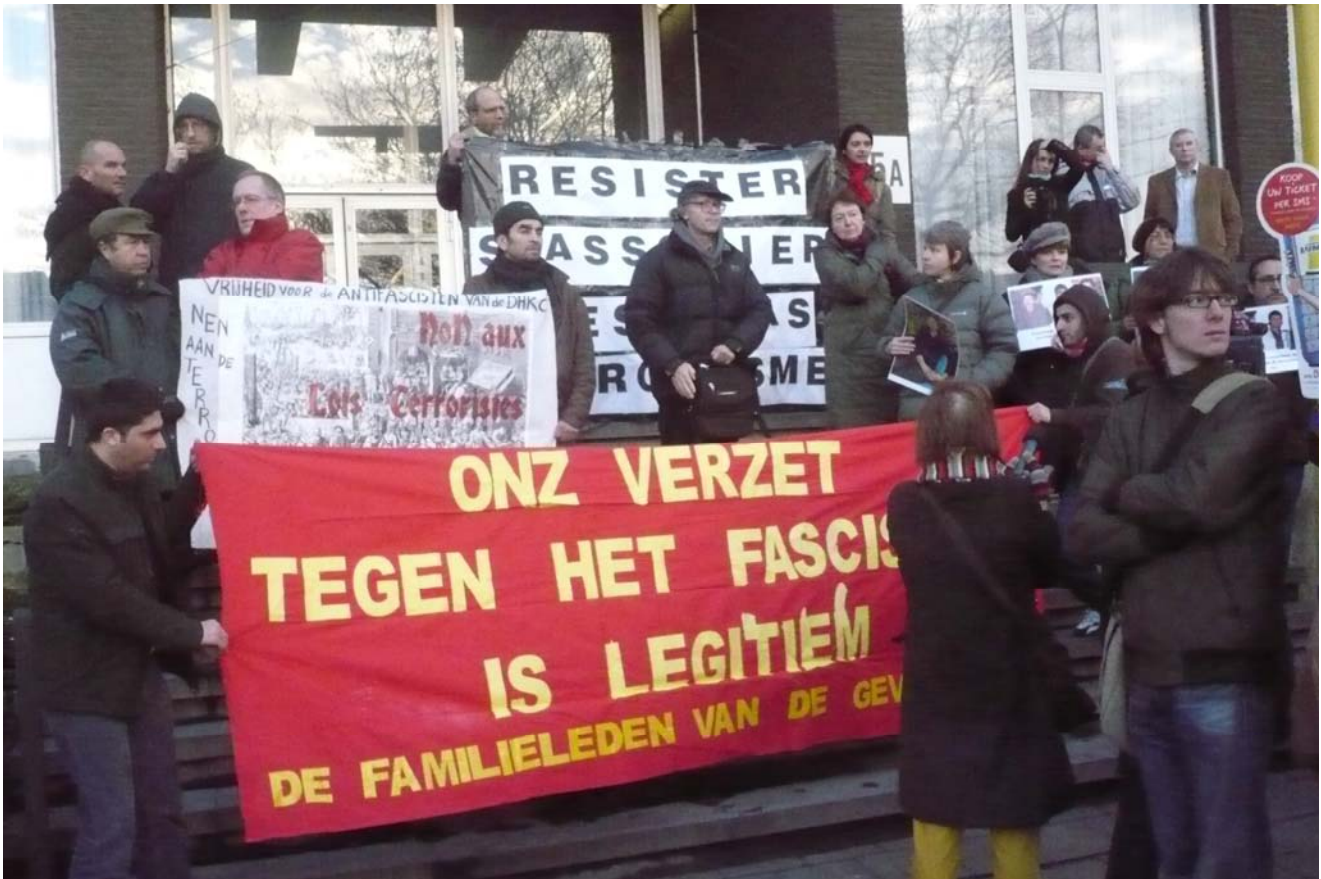
Rassemblement devant la cour d'appel d'Anvers